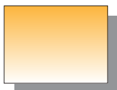
Farb Nr. 131 Lichter Ocker Yellow Ochre ★★ ■