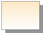
Farb Nr. 068 Fleischfarbe Flesh Tint ★★ ■