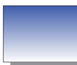
Farb Nr. 392 Ultramarin dunkel Ultramarine Deep ★★ ▣