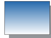
Farb Nr. 428 Ultramarin Himmelblau Sky Blue Ultramarine ★★ ▣