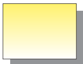
Farb Nr. 116 Primärgelb Primary Yellow ★★ □