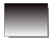
Farb Nr. 535 Elfenbeinschwarz Ivory Black ★★ ■