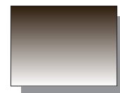
Farb Nr. 486 Sepia Sepia ★★ ■