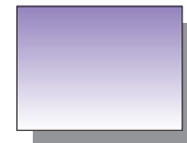
Farb Nr. 463 Permanentviolett bläulich Permanent Violet Blueish ★★ □