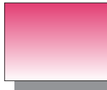
Farb Nr. 253 Permanentrot dunkel Permanent Red Deep ★★ ▣