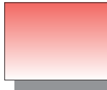
Farb Nr. 251 Permanentrot hell Permanent Red Light ★★ □