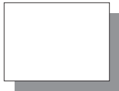
Farb Nr. 013 Chinesischweiss Chinese White ★★ ▣

▣ Halbedeckend Semi-opaque □ Transparent Transparent