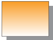
Farb Nr. 098 Indischgelb Indian Yellow ★★ □