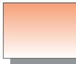
Farb Nr. 278 Siena gebrannt Burnt Sienna ★★ ▣