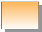
Farb Nr. 114 Permanentgelb dunkel Permanent Yellow Deep ★★ □