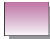
Farb Nr. 465 Permanentviolett rötlich Permanent Violet Reddish ★★ □