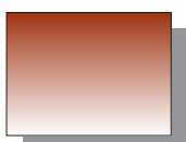
Farb Nr. 244 Englischrot English Red ★★ ■