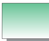
Farb Nr. 340 Permanentgrün dunkel Permanent Green Deep ★★ □