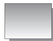
Farb Nr. 514 Paynesgrau Payne's Grey ★★ ▣