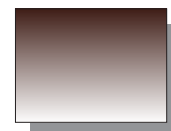
Farb Nr. 492 Umbr gebrannt Burnt Umber ★★ ▣