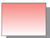
Farb Nr. 174 Carmesinlack Crimson Lake ★★ □