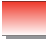
Farb Nr. 274 Scharlachrot Scarlet ★★ □