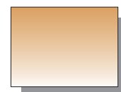
Farb Nr. 493 Umbr natur Raw Umber ★★ ▣