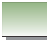
Farb Nr. 296 Grüne Erde Green Earth ★★ □