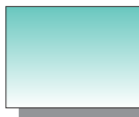
Farb Nr. 321 Phthalogrün Phtalo Green ★★ ▣