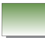
Farb Nr. 358 Saftgrün Sap Green ★★ □